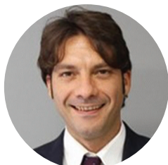
Франко Антоніо ЗЕННА

Предметом наукового інтересу є проблеми захисту прав людини та біоетики у зв'язку зі стрімким розвитком новітніх медичних методик.